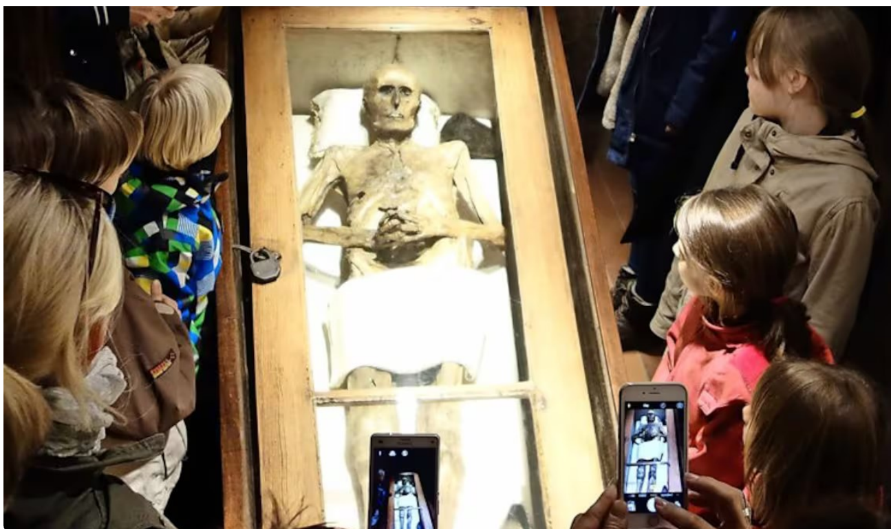
Tolles Ausflugsziel für – etwas größere – Kinder: Ritter Kahlbutz in der Kampehler Wehrkirche.