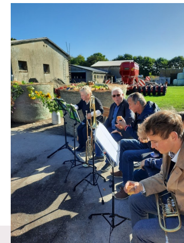
Im Hof Kiesel in Barsikow

Was der Mensch sät, das wird er ernten. Galater 6,7