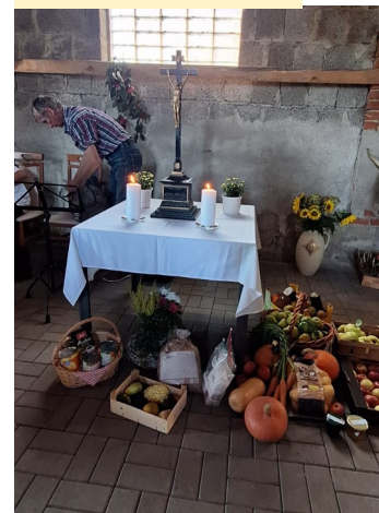
Im Hof Behrend in Nackel